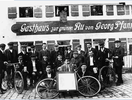
Der Radclub Solidarität im Nürnberger Stadtteil Ziegelstein um 1923 vor dem gemeinsamen Aprilausflug

Gründung von Bauerntheatern. Das Bauerntheater der kleinen oberbayerischen Gemeinde hat bis heute einen guten Ruf. Ein herausragendes Beispiel für freiwillige Arbeit bei Theateraufführungen sind die Oberammergauer Passionsfestspiele. Sie wurden zwar schon lange vor dem Aufblühen kultureller Bereiche während der Weimarer Zeit, nämlich 1633 nach einem Pestgelübde, ins Leben gerufen, erlebten aber gerade in der Zeit nach dem Ersten Weltkrieg einen großen Aufschwung. Die schon 1910 zu verzeichnende einzigartige Massenwirksamkeit setzte sich bei den Inszenierungen in der Weimarer Zeit fort. Die Festspiele, die alle zehn Jahre ein ganzes Dorf mobilisieren, werden heute noch ehrenamtlich organisiert. Auch die Mitspieler erhalten keine Gagen.