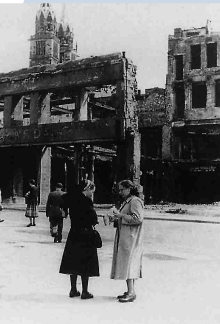
Sammlung des Müttergenesungswerkes kurz nach dem Zweiten Weltkrieg