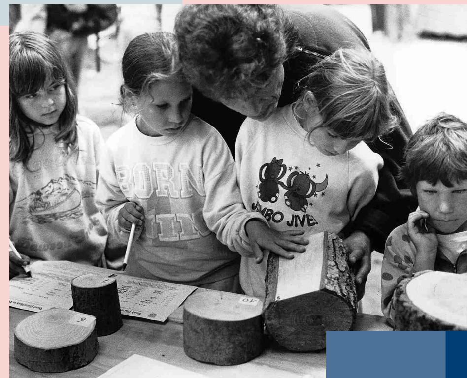
Kinderaktion des Bund Naturschutz

sechziger Jahren eindrucksvoll. Dies wird deutlich, wenn man bedenkt, dass es damals im Bayern vor der Gebietsreform über 4.300 kreisangehörige Gemeinden – mit entsprechenden politischen Ehrenämtern auf kommunaler Ebene – gab. Der Erfolg von älteren Vereinen wie dem Bund Naturschutz, der bereits 1913 gegründet wurde, belegen die Lebendigkeit des Ehrenamts in seiner traditionellen Form bis heute. Einer der wesentlichen Beiträge des Bund Naturschutz war die Initiative zur Errichtung des Naturparks Bayerischer Wald im Jahr 1970. Bei diesem ersten Nationalpark Deutschlands war nicht nur die Durchsetzung der Idee, sondern auch der Schutz des Gebietes und die dadurch anfallende praktische Arbeit ein Verdienst vieler freiwilliger Helfer.