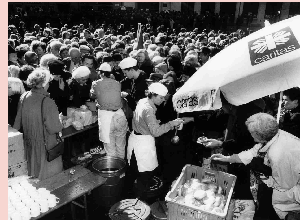
Treffen von 3.000 Sammlerinnen und Sammlern der Caritas in München