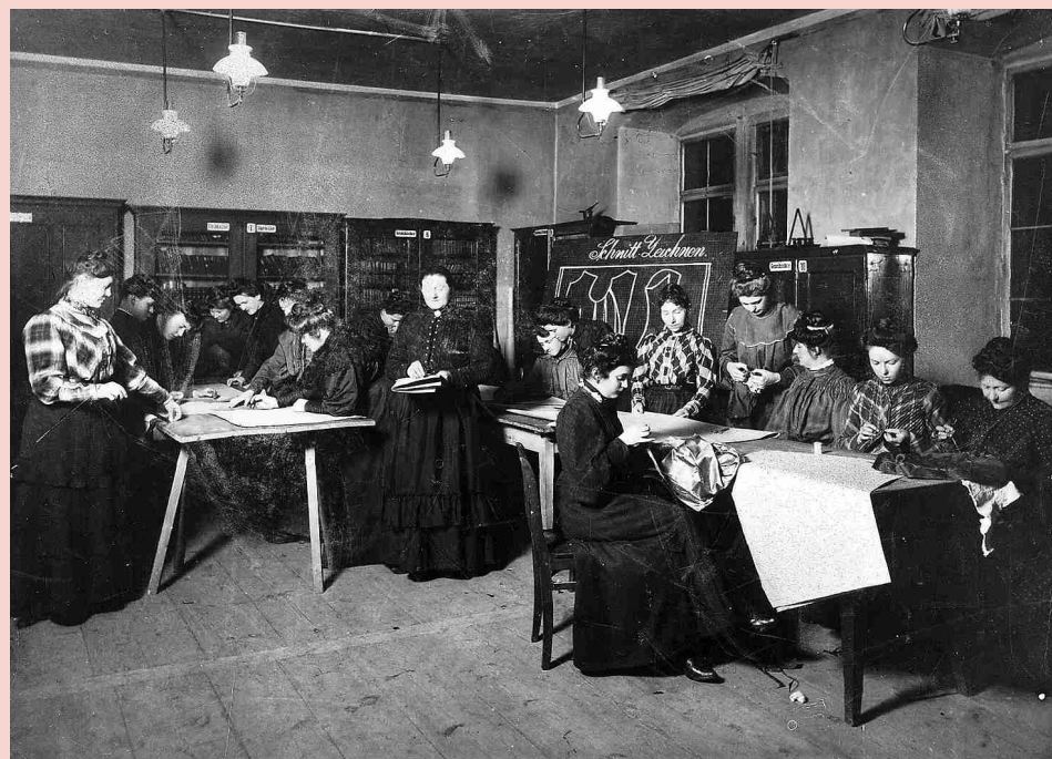
Zuschneidekurs des Vereins Frauenwohl