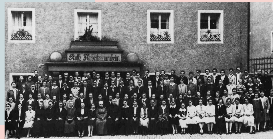
Katholischer Arbeiterinnen- und Dienstmädchenverein Straubing um 1929