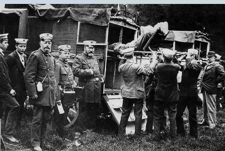
Sanitäter des Roten Kreuzes bei der Übung um die Jahrhundertwende

weitere Ortsgruppen. Vor allem bei der Behandlung von in den Bergen Verunglückten verbesserte man die Arbeit immer weiter. 1927 schließlich kam es in diesem Zusammenhang zur Trennung des Bergführer-Rettungsdienstes „Grünes Kreuz“ vom Roten Kreuz. Die Bergrettung ist auch heute noch in Oberbayern ein wichtiger und vergleichsweise riskanter ehrenamtlicher Dienst am Nächsten, der vom „Grünen Kreuz“, dem Alpenverein und der Bergwacht versehen wird.