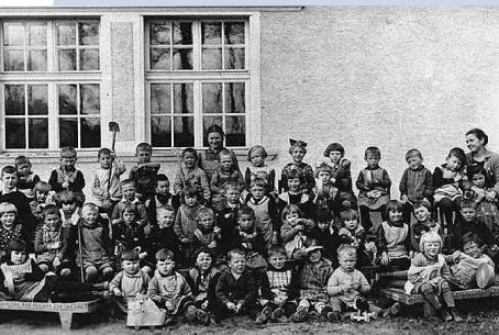
Der erste professionell geführte Kindergarten der Arbeiterwohlfahrt in Bayern um 1927, Loher Moos