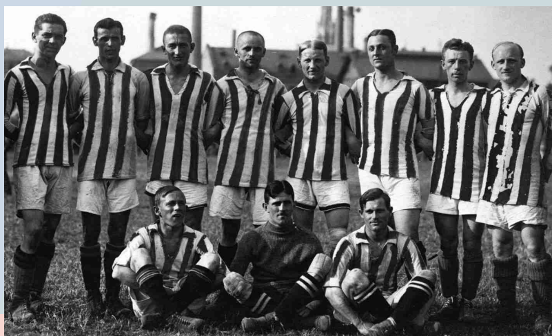
Die erste Fußballmannschaft des TSV 1860 München um 1910

Da revolutionäre Umtriebe ausblieben und Turnen staatlicherseits an sich gern gesehen war, konnten die Münchner bald ein Vereinshaus und eine erste Sportanlage errichten. Neue Schwierigkeiten gab es erst wieder, als die Mitglieder 1899 auch Fußball spielen wollten. Dies war damals für einen Teil der deutschen Turnerschaft keineswegs eine sinnvolle bürgerschaftliche Betätigung, zumal dieser Sport aus England kam. Noch vor der Gründung des FC Bayern begann man dennoch mit dem Training auf der Schyrenwiese. Die Konflikte um den Fußball im Turnverein waren allerdings nicht ausgestanden, und erst in den dreißiger Jahren war Fußball und Turnen offiziell gemeinsam im „Turn- und Sportverein München von 1860“ möglich. Die „Sechziger“ (benannt nach dem Gründungsjahr ihres Vereins) sind so ein gutes Beispiel für die Beharrlichkeit bürgerschaftlichen Engagements, das manche bürokratische Hürde zu überstehen weiß.