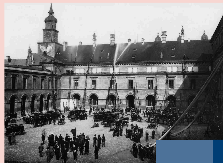
Feuerwehrrübung um 1900 in der Münchner Residenz

Heute gibt es in Bayern annähernd 7.800 Freiwillige Feuerwehren mit 335.000 Aktiven.