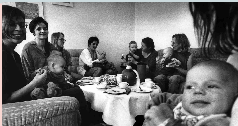
Mutter-Kind-Gruppe um 1980

Das „neue Ehrenamt“ macht Werbung: Stand des Zentrums Aktiver Bürger, Nürnberg