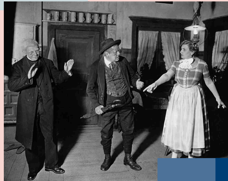
Das Schlierseer Bauerntheater 1926