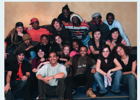
Mitglieder des One World Chor