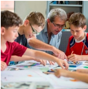
MAL alt werden! SchülerInnen einer 4. Klasse im LdE-Projekt „Alzheimer & You“

Kreativität heißt das Motto in Haßfurt: nicht nur in der Bandbreite von Unterstützungs- und Bildungsangeboten, sondern auch in der Bewältigung aktueller Herausforderungen, wenn irgendwo eine Not und ein neuer Bedarf sichtbar werden. In Haßfurt finden wir daher nicht nur das Prinzip Großfamilie auf moderne Strukturen übertragen, sondern hier wird auch das afrikanische Sprichwort „Um ein Kind zu erziehen, braucht es ein ganzes Dorf!“ in die Tat umgesetzt. Kinder und Jugendliche erleben, dass ihre Probleme von Seniorinnen und Senioren wahrgenommen und ernst genommen werden, und diese Wertschätzung spiegeln sie in ihrem eigenen Verhalten gegenüber anderen. Fast nebenbei verbessern sich bei den zahlreichen ehrenamtlichen Unterstützungshilfen auch so manche Schulleistungen, und Kinder und Jugendliche zeigen Freude am Lernen und Selbstwertgefühl.