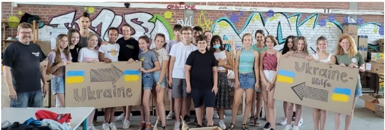
Bamberger SchülerInnen sind zu Recht stolz auf ihr Engagement.

Kinder und Jugendliche entwickeln so mitten in unserer Wegwerfgesellschaft auch ein Bewusstsein für Wiederverwertbarkeit von Ressourcen.