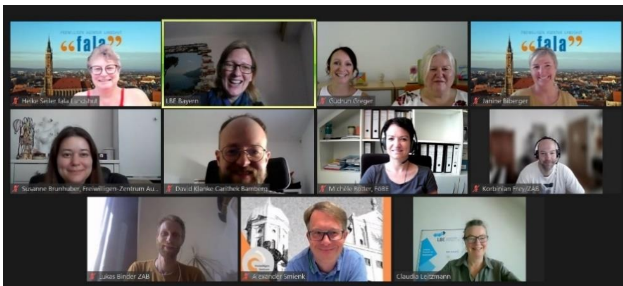
Fachkompetenz und positive Stimmung in produktiver Kombination bei den Austauschtreffen des LBE mit den Anlaufstellen

Das Landesnetzwerk Bürgerschaftliches Engagement Bayern e.V. (LBE) bietet als Koordinierungszentrale fachliche und verwaltungstechnische Beratung und Unterstützung für die einzelnen Anlaufstellen im Netzwerk und erarbeitet überregionale Standards und Strukturen für Schulen und Bürgerengagement.