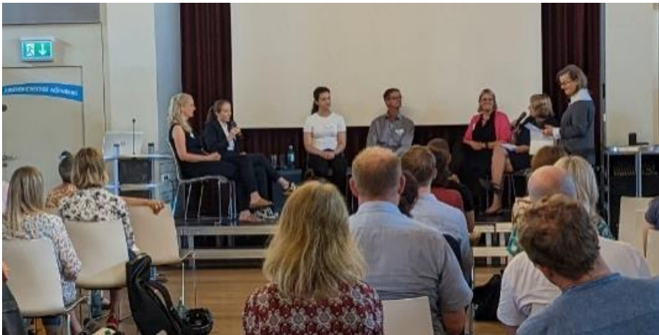
Diskussionsrunde bei der Nürnberger Lernen-durch-Engagement-Tagung: Natürlich mit echter Schülerbeteiligung!

Das LBE führt selbst Fortbildungen für LdE-SchulbegleiterInnen durch und setzt sich für die Verankerung dieser Lern- und Lehrmethode in den bayerischen Lehrplänen und in der Lehrer-Aus- und -Fortbildung ein. Im Konzept der Anlaufstellen für Schulen und Bürgerengagement wird dies erstmals zusammengedacht und die positiven Transfer-Effekte zwischen Schule und Zivilgesellschaft werden sichtbar.