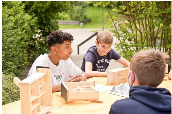
Engagement gepaart mit Kreativität und Handwerk – ob im P-Seminar Geographie am Gymnasium oder in der Mittelschule...

„So motiviert habe ich meine Klasse noch nie erlebt!“