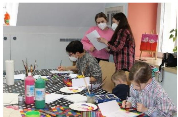
In der „FamilienKUNSTbande“ treffen sich Alt und Jung aus unterschiedlichen Kulturen: Die Erwachsenen vernetzen sich, die Kinder finden Freunde und werden kreativ.

Anders als in Großstädten ist für ländliche Regionen längst nicht selbstverständlich, was man in Haßfurt sehen kann: Alteingesessene SeniorInnen in vertrautem Umgang mit Flüchtlingskindern, Frauen mit Kopftüchern, die von deutschen Jugendlichen Briefe und Formulare erklärt bekommen und als