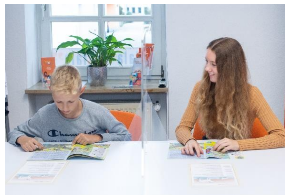
Leseförderung – zur Not auch mit Abstand, aber immer mit Herz!

Persönliche Projektvorstellungen mit Plakaten werden inzwischen auch von Schulen und Einrichtungen in den Landkreisen angefragt, und besonders bei der Suche nach HelferInnen für die Ukraine-Flüchtlinge wurde die fala zur ersten Adresse. Schulfamilien und ganze Schulämter zeigen sich überrascht von der Vielfalt ehrenamtlicher Unterstützung und dankbar für die Orientierung und